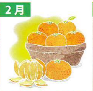
2月 旬のみかん詰め合わせ (三重県産/2kg)