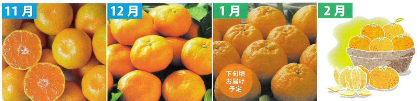
11月 早生みかん (三重県産/2kg) 下旬頃お届け予定 12月 完熟みかん (三重県産/2kg) 1月 ポンカン (三重県産/2kg) 2月 旬のみかん詰め合わせ (三重県産/2kg)