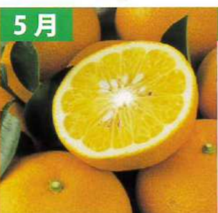
5月 サマーフレッシュ (三重県産/6玉)