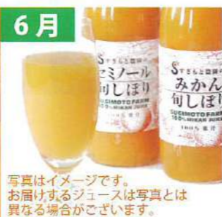
6月 100%ストレートジュース (三重県産/720ml x 2本)

ご注文後請求書を郵送させていただきますので、お支払いをお願いします。入金確認後商品をお届けさせていただきます。