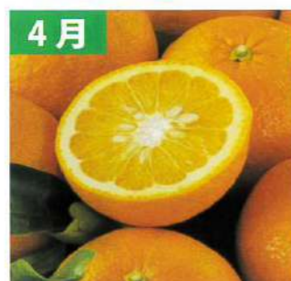
4月 木なり甘夏 (三重県産/6玉)