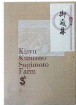
熨斗見本 (短冊熨斗)