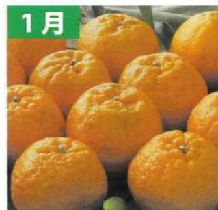
1月 ポンカン (三重県産/2kg)