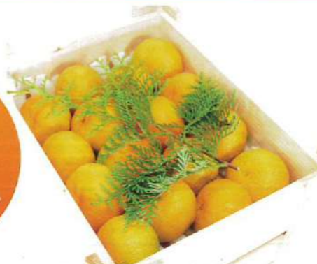
写真：檜箱(ひのきばこ)