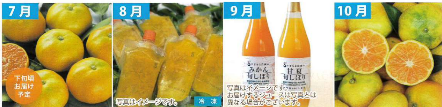
7月 ハウスみかん (三重県産/1kg) 下旬頃お届け予定 8月 CHU CHU MIKAN (三重県産/200ml x 6個) 写真はイメージです。冷凍 9月 100%ストレートジュース (三重県産/720ml x 2本) 写真はイメージです。お届けするジュースは写真とは異なる場合がございます。 10月 極早生みかん (三重県産/2kg)