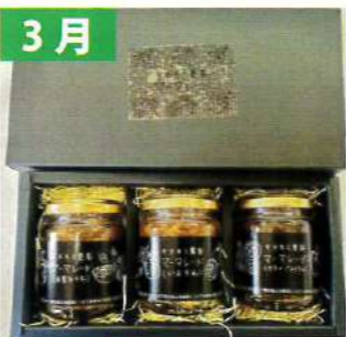
3月 マーマレード (三重県産/3種)