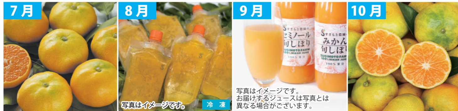
7月 ハウスみかん (三重県産/1kg) 8月 CHU CHU MIKAN (三重県産/200ml x 6個) 9月 100%ストレートジュース (三重県産/720ml x 2本) 10月 極早生みかん (三重県産/3kg)