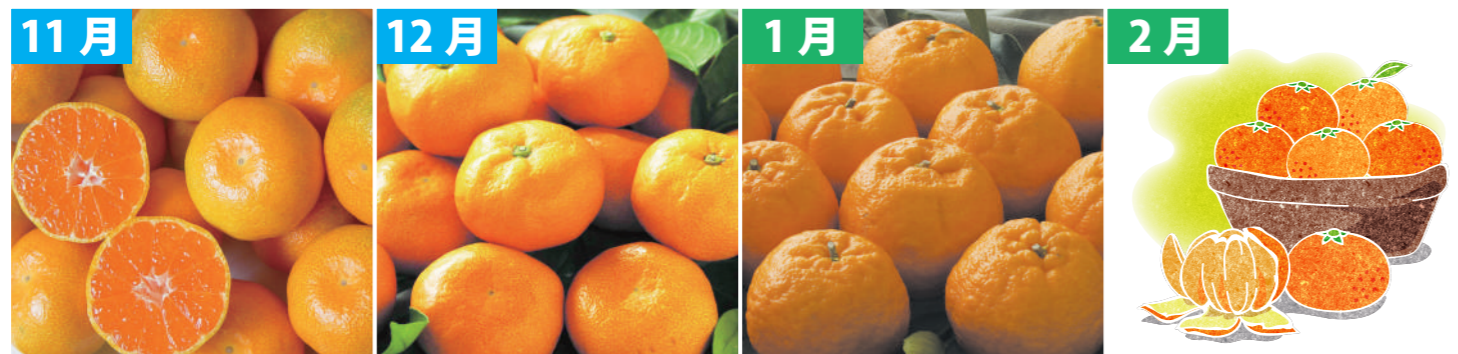
11月 早生みかん (三重県産/3kg) 12月 完熟みかん (三重県産/3kg) 1月 ポンカン (三重県産/2kg) 2月 旬のみかん詰め合わせ (三重県産/2kg)