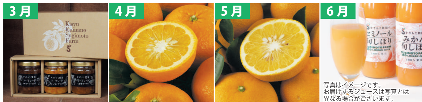
3月 マーメイド (三重県産/3種) 4月 木なり甘夏 (三重県産/6玉) 5月 サマーフレッシュ (三重県産/6玉) 6月 100%ストレートジュース (三重県産/720ml x 2本)

1年コースなら3,500円もお得! 毎月お届けするマンスリー便! 全3コースからお選びください【送料込み】